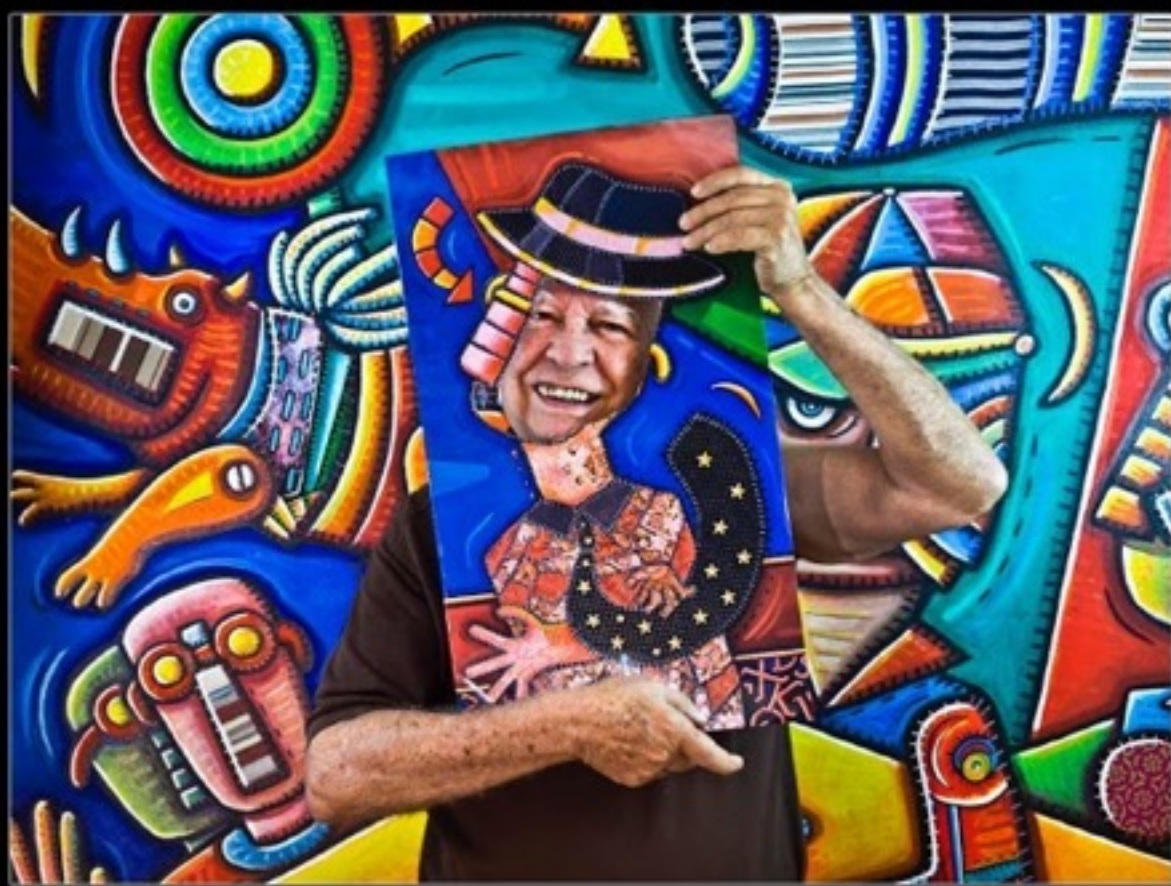
Sosabravo Artista plástico La Habana, Cuba www.hectorgarrido.com