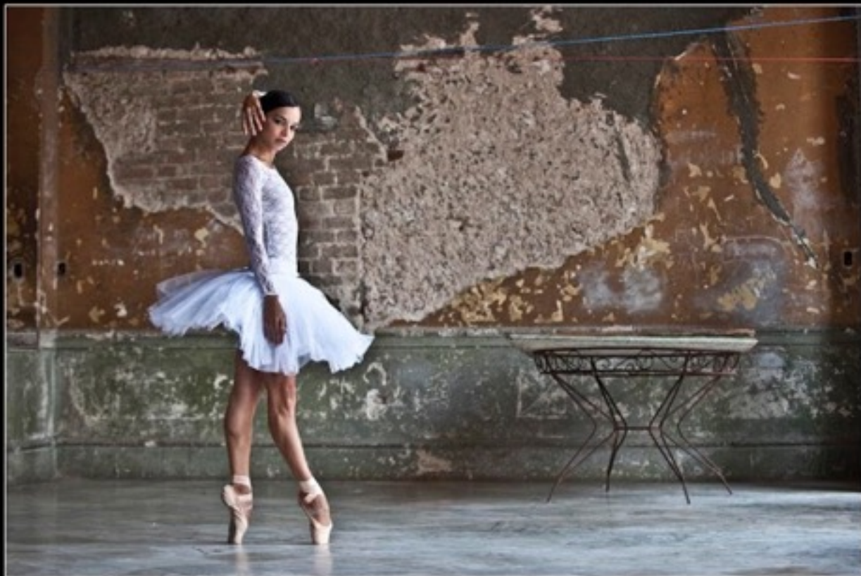
Viengsay Valdés Primera bailarina Ballet Nacional de Cuba La Habana, Cuba www.hectorgarrido.com